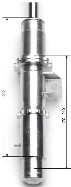
Fahrwerk Achse 1